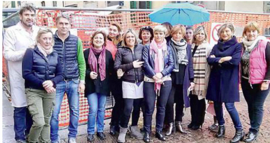
I negozianti di corso Matteotti hanno chiamato La Nazione e inviato una lettera a Publiacqua

« HO DUE NEGOZI e un dipendente – ha detto uno del gruppo –, e forse sarò costretto a chiudere e licenziare visto che i clienti nel corso non vengono più». «Non si può aprire una buca di duecento metri con tre persone sole a lavorare – aggiunge una collega –, potevano fare 50 metri alla volta e chiudere a tratti. «Anche perché gli operai fanno festa alle cinque e a volte non c’è nessuno», aggiunge un altro. «In compenso lasciano tutte le macchine nel mezzo – interviene un commerciante – tanto che abbiamo trascorso le feste di Pasqua con le inse-